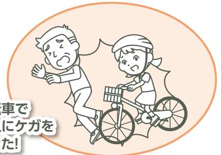
自転車で 他人にケガを させた!