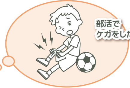
部活で ケガをした!