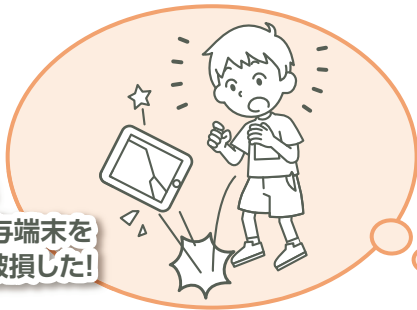
自宅で 学校貸与端末を 誤って破損した!