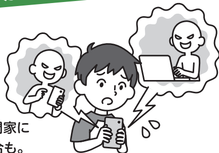
パソコンや携帯電話等を使ったいじめの認知件数